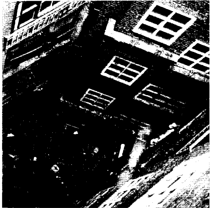
De verloederding van het leefklimaat werkt onveiligheid in de hand

Voldoende argumenten dus om de enge optie die aanvankelijk genomen werd (de reductie van kleine criminaliteit) aan de omstandigheden aan te passen: de verbetering van de „leefbaarheid” van de woonomgeving. Daardoor staat niet langer de aanpak van kleine criminaliteit centraal maar het werken aan een „soci-