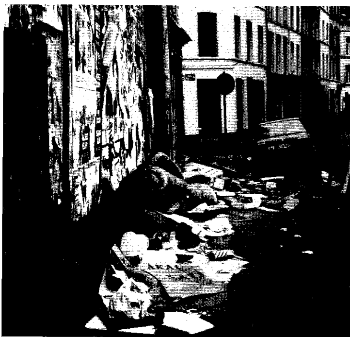
Ergens in de hoofdstad van Europa

Aan deze visie zijn consequenties verbonden.